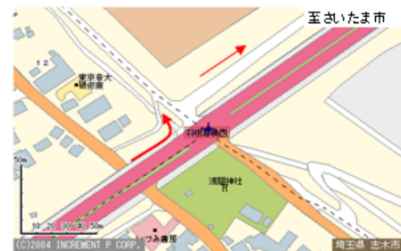
浦和所沢バイパス 羽根倉橋西信号付近詳細図